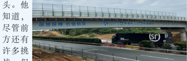
▲ 京港澳跨高速人行天桥

夜幕降临，车间内依旧灯火通明。工人们轮班工作，确保制作进度不受影响。在这样的努力下，钢桁架的制作进度稳步推进。项目经理在巡视一圈后，满意地点了点头。他知道，尽管前方还有许多挑战，但团队的默契配合和敬业精神将使他们克服一切困难，最终完成这项宏伟的工程。