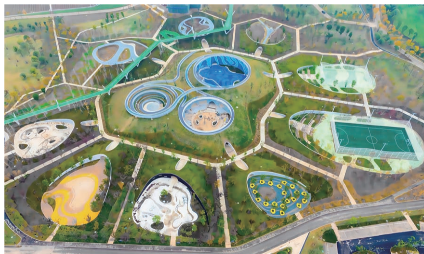
大泽湖近自然湿地公园廊桥已建好的区域 徐洁 中建钢构（华中）