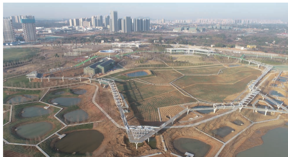
大泽湖近自然湿地公园目前廊桥在建区域 徐洁 中建钢构（华中）