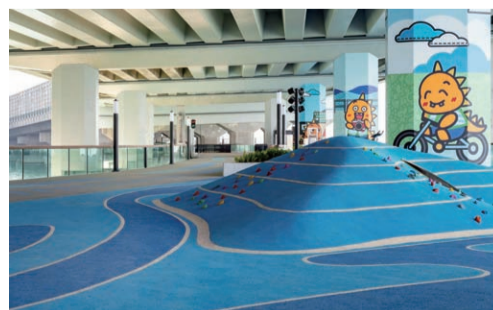
香港东区走廊人行板道项目 李银杏 国际公司