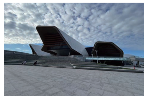
春！天津国家海洋博物馆之旅 设计研究院 于琦