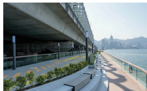
香港东区走廊人行板道项目 李银杏 国际公司